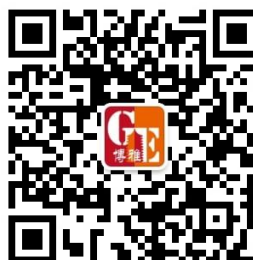
北大通识教育平台---通识联播