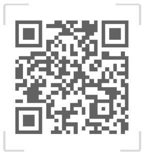
学术研讨空间预约系统