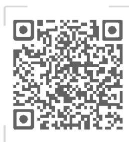
课程评估微信公众号